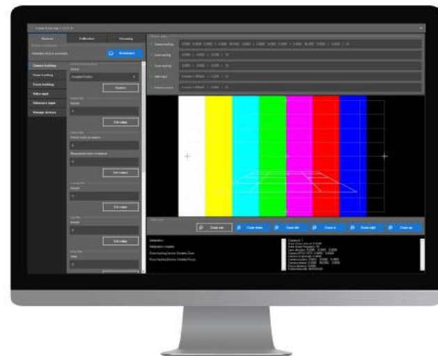
PRIZM SE V 2.24.0525

начало и направление осей системы координат